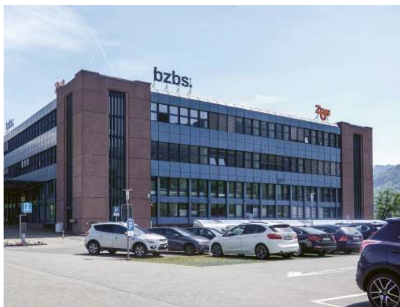
Im weiteren Vorgehen wird zu prüfen sein, welche Schulen, schulergänzenden Einrichtungen und Organisationen im Campus integriert werden können. Das bzbs zu integrieren wird für einen erfolgreichen Campus besonders wichtig sein.

EINE BREITE UNTERSTÜTZUNG IST ERFOLGSENTSCHEIDEND